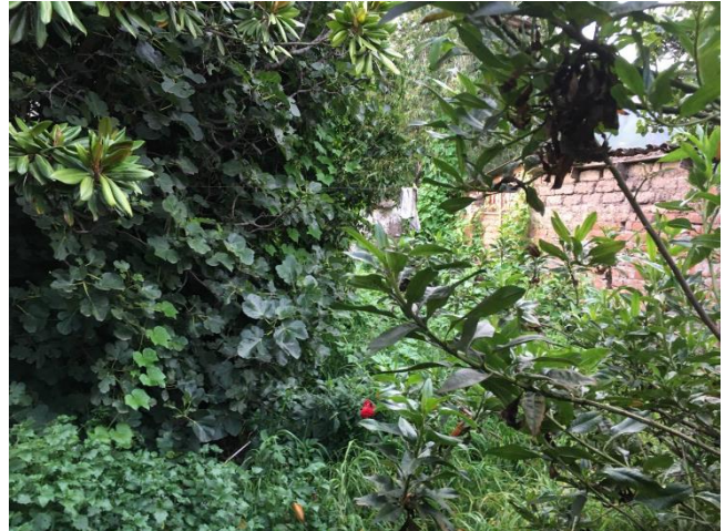
Het pand en de moestuin van Mujer Nueva voor de verbouwing.