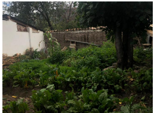
Het pand en de moestuin van Mujer Nueva in gebruik.