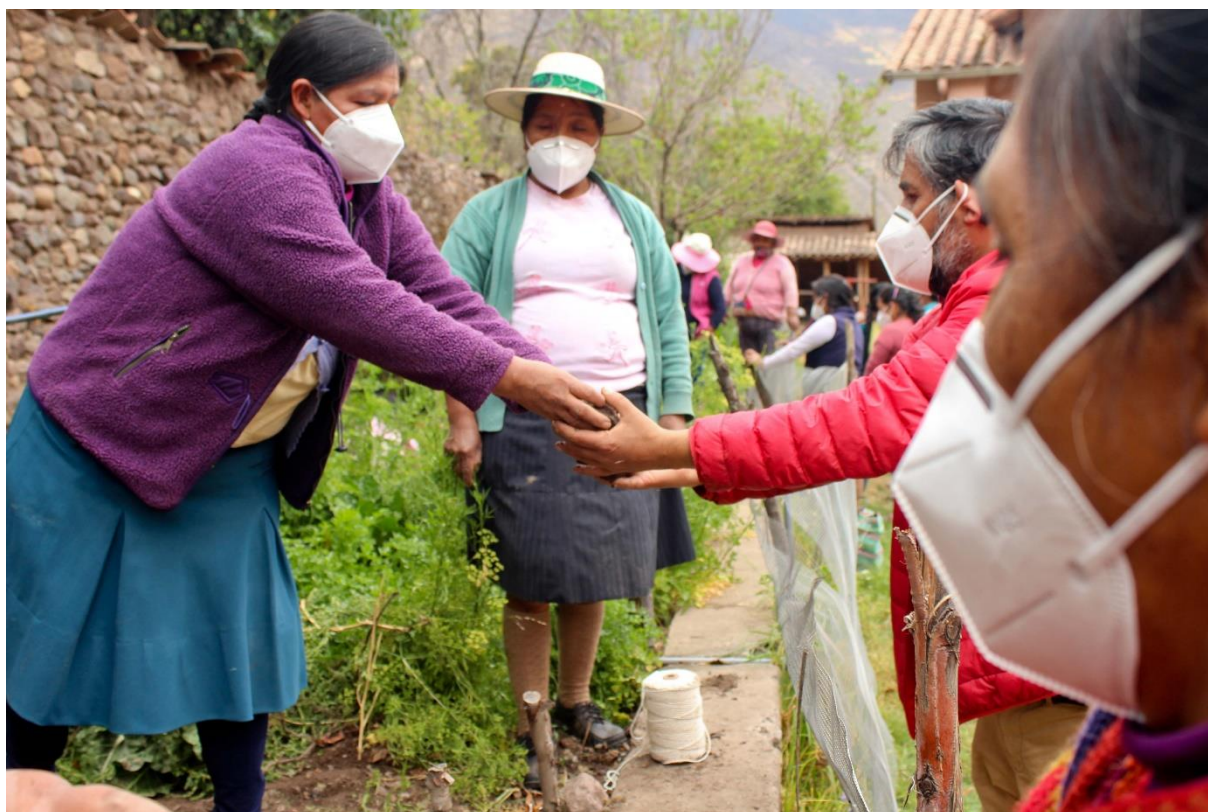
Pachachaca is een naam die in de inheemse taal Quechua 'Eenheid van alles op Aarde' betekent.

Als gevolg van de crisis werd het bestaansrecht van Pachachaca des te duidelijker. Dankzij de ervaring en het vertrouwen dat we de afgelopen jaren hebben opgebouwd binnen de gemeenschap, konden we veel betekenen. Het was daarbij mooi te ervaren dat het in de Andes gehanteerde principe Ayni haar kracht in de praktijk bewees. Ayni betekent wederkerigheid en is gebaseerd op het idee dat alles en iedereen met elkaar verbonden is. Het afgelopen jaar werkten wij nog meer op basis van gelijkwaardigheid samen met de gezinnen uit de gemeenschap: Pachachaca deelde wat zij kon delen met de gezinnen, o.a. in de vorm van voedselpakketten, medicijnen en andere basisbehoeften. De gezinnen hielpen op hun beurt Pachachaca door bijvoorbeeld te helpen in de moestuin en het repareren van schoenen, fietsen en woningen van andere gezinnen. Op die manier konden wij onze activiteiten in de vorm van een gelijkwaardige uitwisseling implementeren, voortbouwend op de talenten en de gemeenschapszin van alle deelnemers.